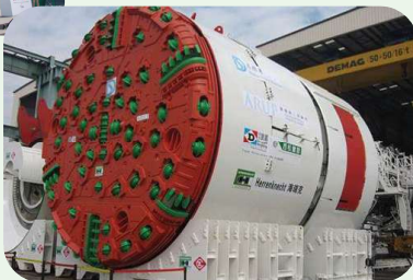
港島西雨水排放隧道工程所使用的隧道鑽挖機