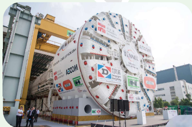
屯門至赤鱗角連接路-北面連接路海底隧道段工程所使用的隧道鑽挖機

每組設有冠、亞、季軍各一名，分別獲頒贈獎狀乙張及以下獎項： 學校組- 價值$2000, $1000及$500之書券 公開組- 價值$2000, $1000及$500之超市現金券